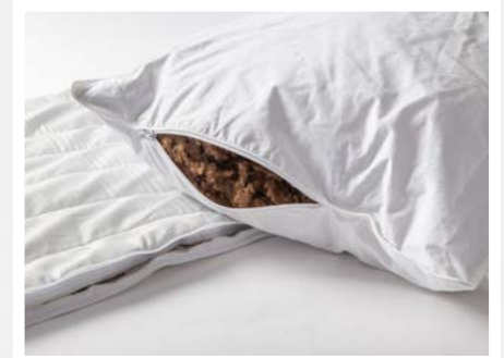
Aanpasbaar binnenkussen met kameelhaar bolletjes